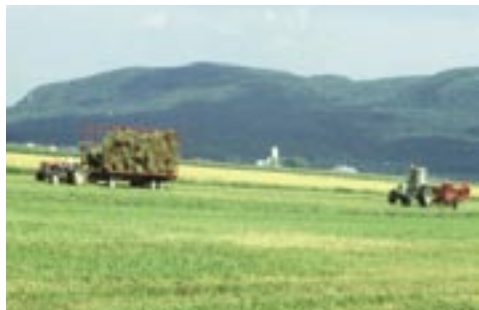
L'agriculture, un secteur vital.

française, l'une des plus modernes et des plus performantes de la planète, est parfaitement intégrée aux circuits commerciaux nationaux et mondiaux. Elle n'est qu'un maillon central dans le puissant système agro-industriel qu'est la filière agricole.