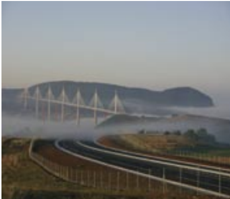
Le viaduc de Millau.

De grands groupes tels que Bouygues construction (leader européen), Vinci ou Spie-Batignolles tirent le secteur du BTP et mettent en place des technologies de plus en plus pointues permettant la réalisation de travaux d'envergure (Viaduc de Millau, Stade de France, etc.).