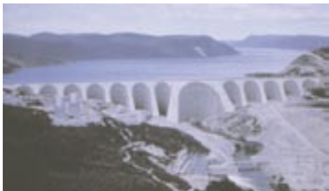
Le barrage Manic 5 au Québec.

Le Québec importe cependant la majorité des autres sources d'énergie de l'Ouest canadien (hydrocarbures et gaz naturel). Le Canada est le 2 e pays mondial en terme de réserves d'hydrocarbures.