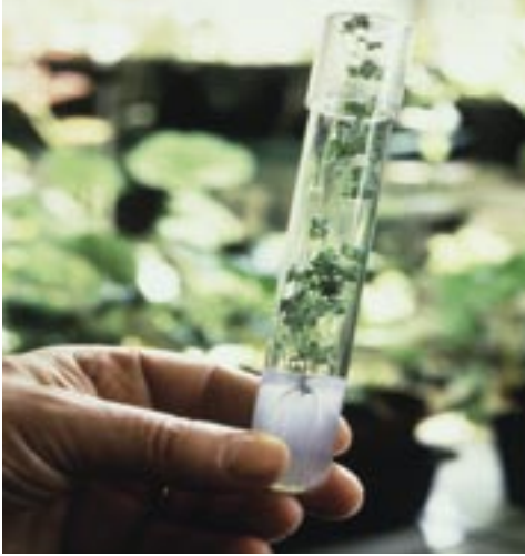
La recherche est encouragée en France et au Québec.

L'Union européenne s'est fixé comme objectif de consacrer 3 % de son PIB pour les dépenses en R&D lors du Sommet de Barcelone en 2002. La France, qui a contribué à de grandes découvertes mondiales (identification du virus VIH du sida en 1983, fécondation artificielle, etc.), se tourne aujourd'hui vers la recherche