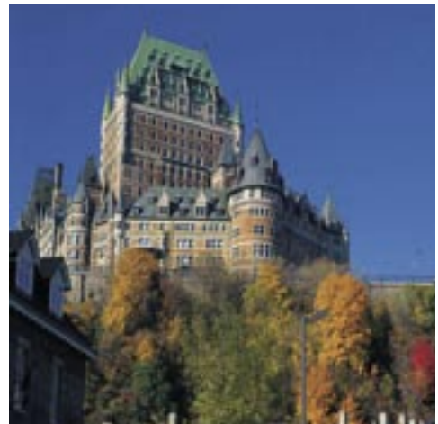
Le château Frontenac à Québec, un des lieux les plus visités du Québec.

près de 28,3 millions de touristes (étrangers et Canadiens) qui ont engendré un chiffre d'affaires de 7,2 milliards de $. Québec, grâce à sa vieille ville classée au patrimoine de l'UNESCO, est devenue la 16 e ville la plus visitée au monde. Les attractions majeures de la province sont les festivals de Montréal, le cachet européen de la ville de Québec et les grands espaces naturels. En 2000, trois Français sur quatre ayant visité le Canada se sont rendus au Québec. Ils constituent la deuxième clientèle internationale, loin derrière les Américains. La clientèle touristique française représente le plus grand marché européen du Québec et se distingue par ses déplacements en grand nombre dans les régions, à l'extérieur des centres urbains de Montréal ou de Québec.