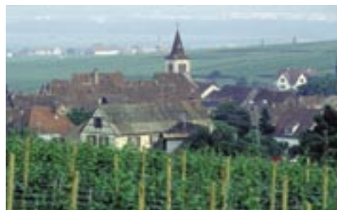
Un vignoble en France.

L'agriculture a connu depuis trois décennies une modernisation remarquable qui a permis des gains spectaculaires de productivité grâce à des rendements en très forte progression.