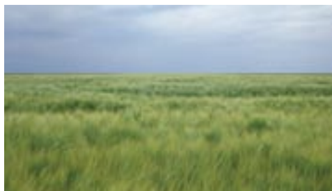
Les plaines céréalières.

tout le territoire contribue au développement et à la pérennité des régions.