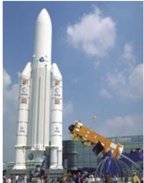
La fusée Ariane 5.

Satellite System ). Ce programme, cofinancé par l'Union européenne et l'Agence spatiale européenne (ESA), servira dès 2010 à de multiples applications et pourra, à l'image du système GPS, être utilisé dans de nombreux secteurs d'activité : transports aérien et routier, navigation maritime, agriculture, etc.