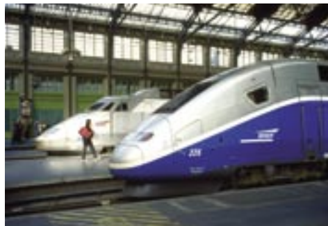
Le train à grande vitesse (TGV).

train à grande vitesse, ou TGV (record de vitesse mondiale avec 515 km/h),