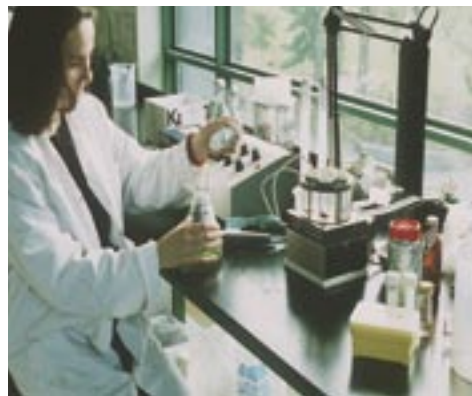
Les chercheurs sont à l'origine des grandes découvertes de la science.

Les mesures favorables à la R&D sont parmi les raisons principales qui font du Québec un lieu attrayant pour l'implantation d'entreprises. Au-delà du fait de se maintenir parmi le peloton de tête des pays performants en R&D, le Québec veut faire passer la part des entreprises dans le financement de la R&D de 60 % en 2002 à plus de 66 % en 2010, soit de 3,9 milliards de dollars à 6,6 milliards de dollars. Le gouvernement québécois compte atteindre cette cible grâce à la création du Conseil des partenaires de l'Innovation , dont le rôle consultatif portera sur la politique provinciale de la science et de l'innovation. Ce conseil regroupera des représentants du milieu de la recherche publique, des associations concernées et des experts de l'industrie.