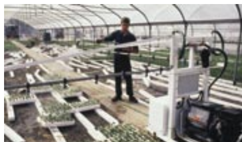
Des équipements modernes pour intensifier les rendements.

démographique et au manque de relève, à la concentration accélérée des entreprises, à la dévitalisation progressive du milieu rural, à la croissance de l'agriculture à temps partiel et à l'accroissement de la valeur des actifs et de l'endettement. Parmi ces menaces, il y a toute la question de la libéralisation des échanges commerciaux qui affectent particulièrement les producteurs laitiers et avicoles.