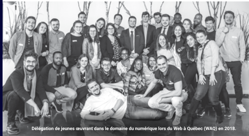
Délégation de jeunes œuvrant dans le domaine du numérique lors du Web à Québec (WAQ) en 2018.