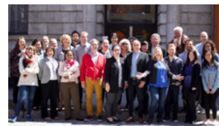
Équipe à Montréal, Québec