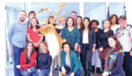
Équipe à Paris, France