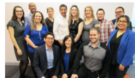
Équipe à Québec, Québec